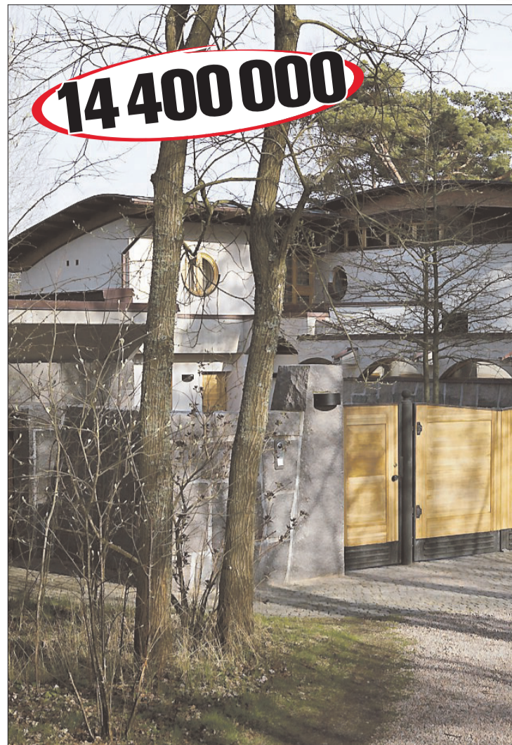
EN RIKTIG GULDVILLA Taxeringsvärdet 14,4 miljoner betyder att Per Gessle äger Sveriges