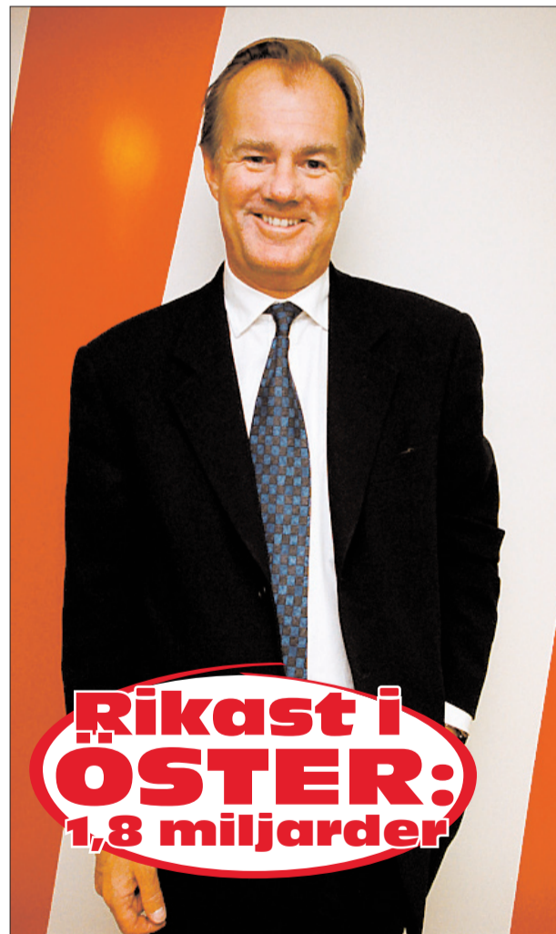
KLÄDMAGNATEN H&M:s Stefan Persson.