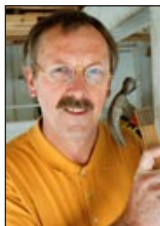
Idé, text och bild LEIF QVIST