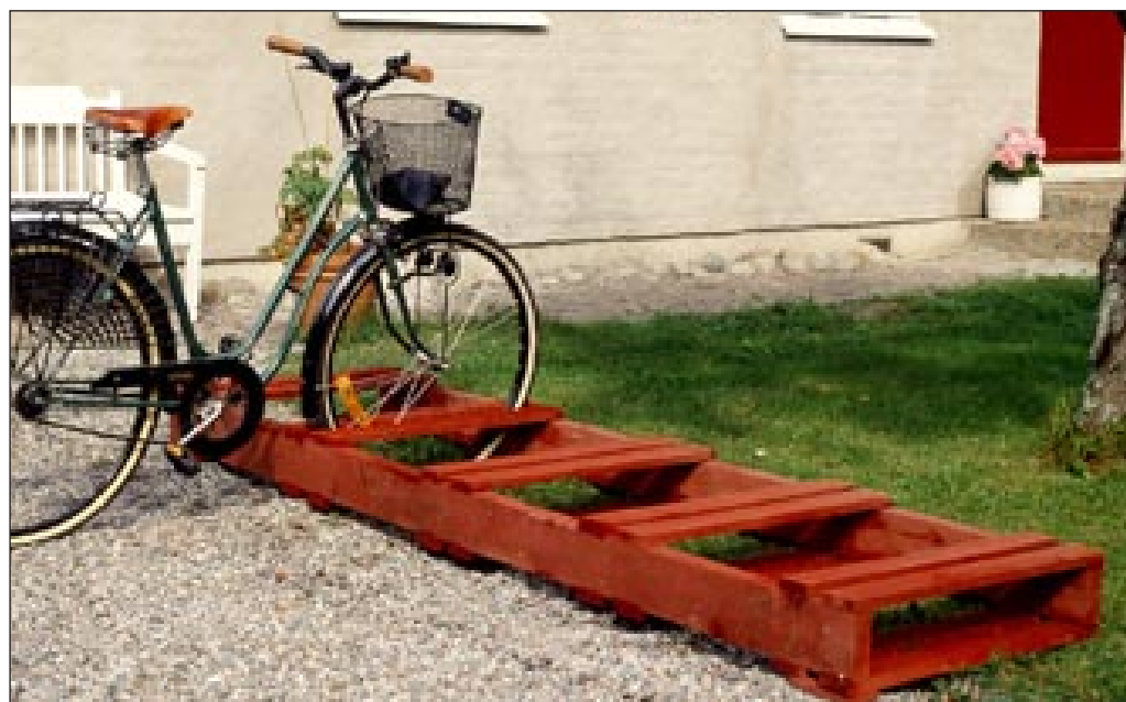
Så här fint blir cykelstället när det är klart. Lätt som en plätt!